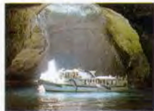
堂ヶ島天宮洞と波乗り